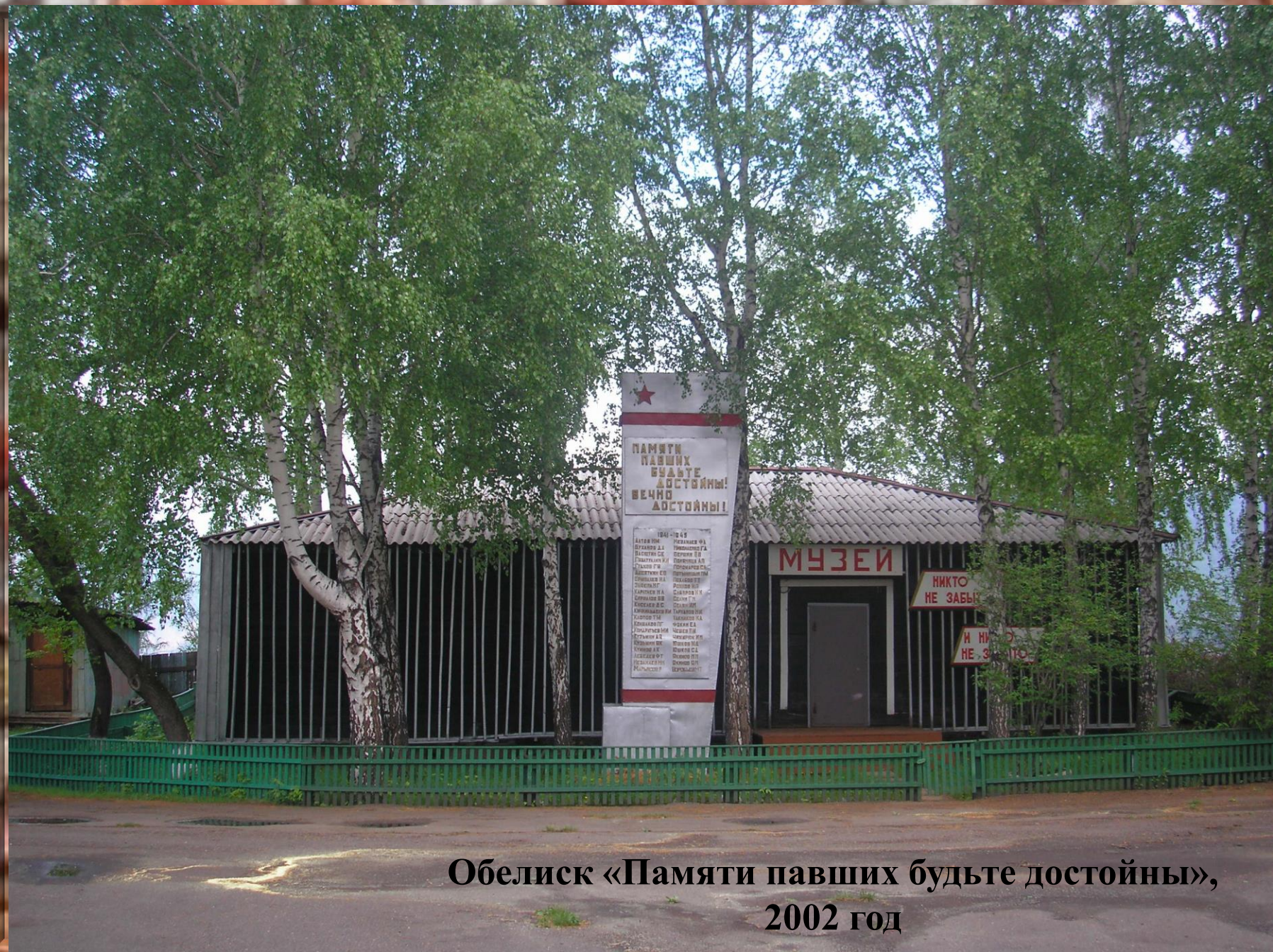
Обелиск «Памяти павших будьте достойны», 2002 год