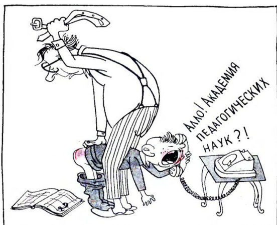
Рисунок О. КОРНЕВА