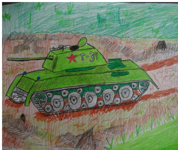
Пугачев К., 8В