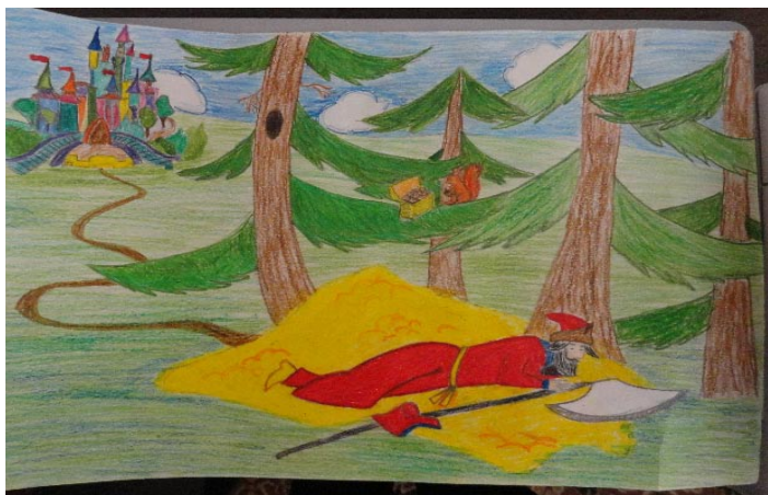
Мечкавская Е., 7Б