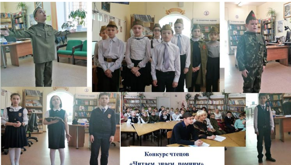
Конкурс чтецов «Читаем, знаем, помним»