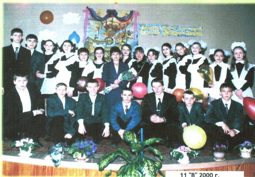
11 "В" 2000 г.